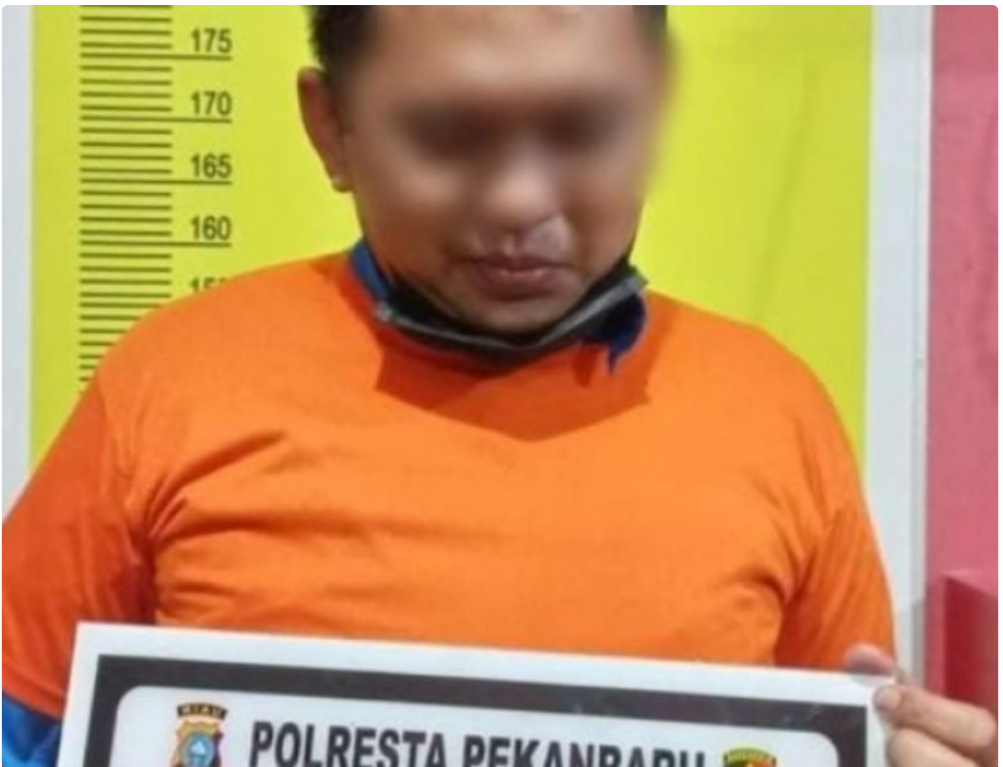
LY Akhirnya Resmi Menjadi Tersangka

Pekanbaru, -Penyidik Satuan Reserse Kriminal (Satreskrim) Polresta Pekanbaru menetapkan oknum aktivis berinisial LY sebagai tersangka, Senin (14/3/2022) malam.